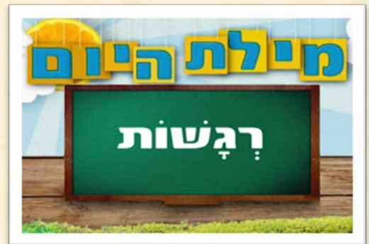
לצפייה בסרטון מה משמח אותי

בחג פורים אנו מצווים לתת מתנות. איש לרעהו בצורת משלוח מנות ומתנות לאביונים. למושג מתנה יש משמעויות רבות ואם תרצו, תוכלו לחקור אותן עם הילדים.