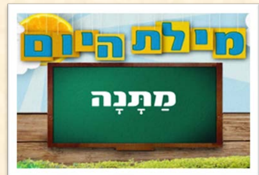
לצפייה בסרטון מילת היום - מתנה

בחג פורים אנו מצווים לתת מתנות. איש לרעהו בצורת משלוח מנות ומתנות לאביונים. למושג מתנה יש משמעויות רבות ואם תרצו, תוכלו לחקור אותן עם הילדים.