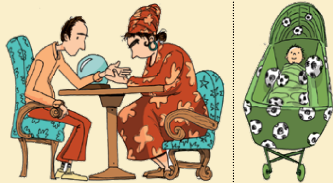
איורים: מנחם הלבברשטט

בחרו באחד האיורים, והסבירו כיצד הוא קשור לנושא הבחירה החופשית. צטטו משפט מאחד המקורות שלמדתם כדי להסביר זאת.